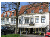
Hotel Restaurant Die Port van Cleve *** (Enkhuizen)