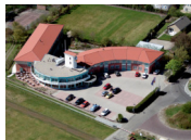
Fletcher Duinhotel Burgh Haamstede **** (Burgh Haamstede)

Quando selezioniamo gli hotel, verifichiamo che abbiano un deposito biciclette sicuro e al chiuso. Tuttavia, questo non è sempre possibile, dipende da hotel a hotel e dal numero di biciclette depositate dagli altri ospiti della struttura.